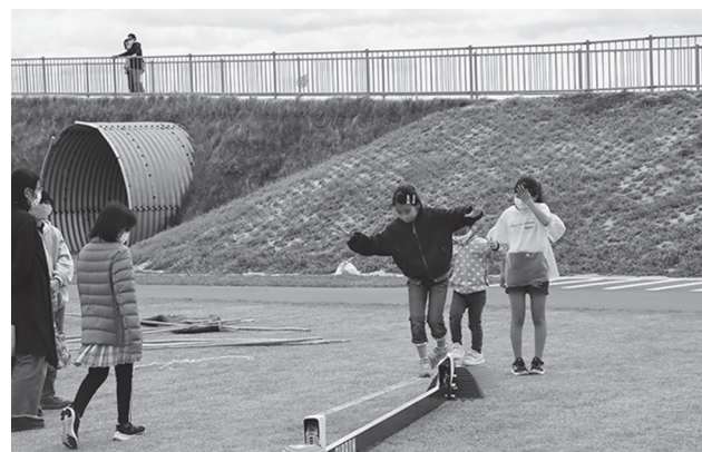
▲スラックラインを楽しむ子どもたち