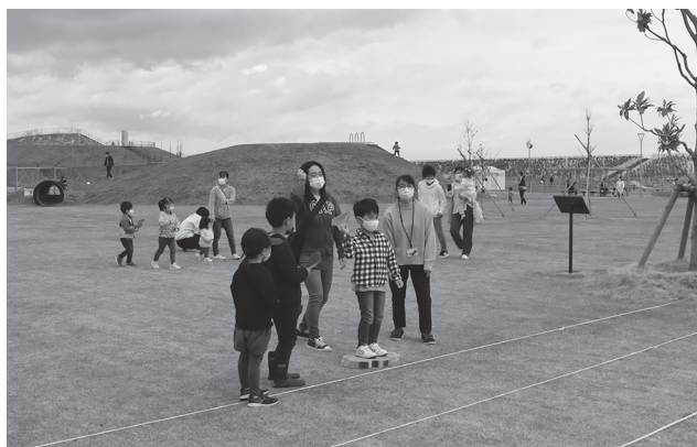
▲紙飛行機飛ばし大会