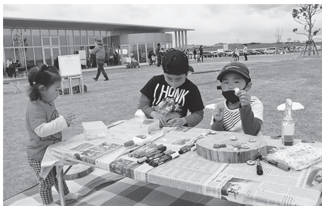
▲流木や貝がらで工作