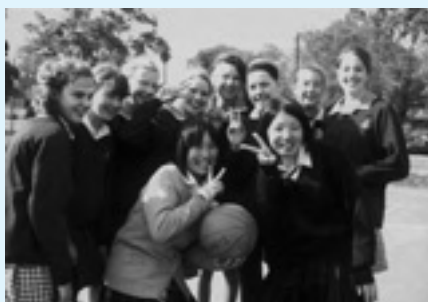
▲国境を越えた友達が出来ました。

今回、この旅で英語を学ぶ事他に、かけがえない仲間の存在、文化の違い、広い心を持つことを学びました。私は、とても大切な時を一生の思い出として、日本へ持ち帰ることができました。私を家族の一員としてみてくれたホストファミリー、そしてこの旅に行かせてくれた私の家族に感謝します。ありがとうございました。Thank you very much!