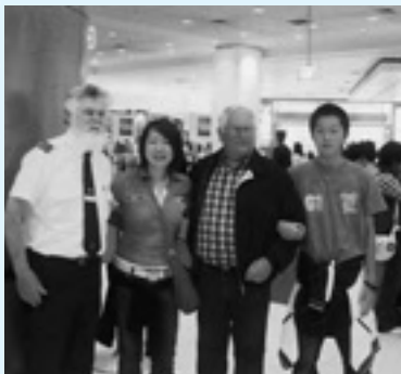
▲たくさんの人たちに出会い、たくさん思い出ができました。