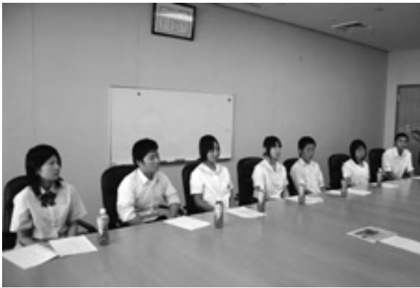
▲帰国後の報告会（役場会議室）