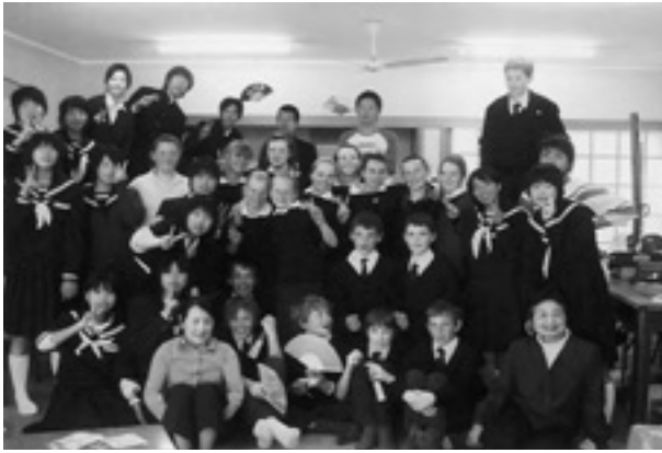
▲オーストラリアでの学校訪問。友達がたくさんできました。