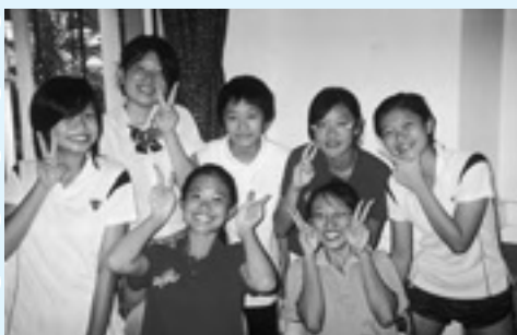
▲みんな楽しい仲間たちです。

私がシンガポールで知り合った友達、経験した貴重な体験、それらは今後忘れることはないでしょう。