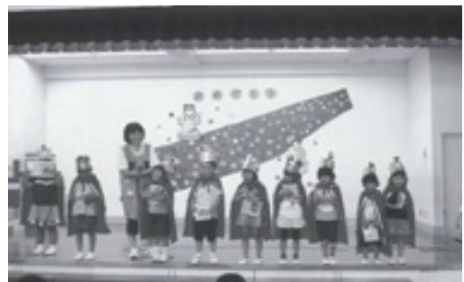
▲一人一人が主役の誕生会

ステージに誕生児が並び、名前と何歳になったか、大きくなったら何になりたいかなど、インタビューがあります。