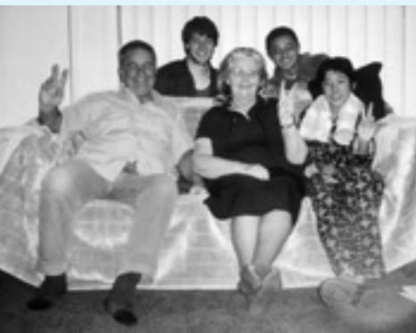
▲私を家族の一員として受け入れてくれたホストファミリー。

あつという間の2週間でしたが、たくさん思い出ができました。今回の旅に参加して本当に良かったです。一緒に行きたみんな、色々とお世話になりました。ありがとうございました。