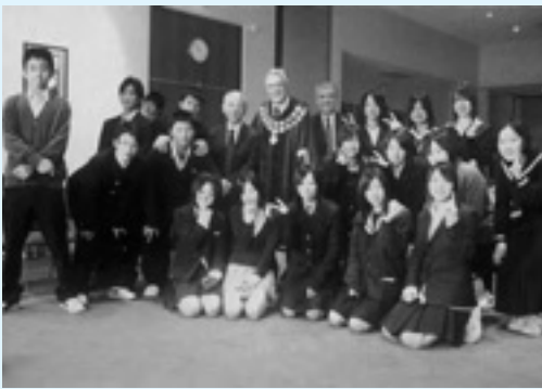
▲フェアヒルズ高校で

最後の日、さよならパーティーがあり、みんな楽しく話したり、記念撮影をしました。一生の宝になりました。このホームステイで学んだこと、体験したことは将来に生かせるようにしたいです。そして最後に、最高の思い出と貴重な体験をさせてもらい、とても感謝しています。ありがとうございました。