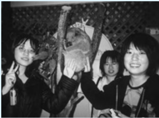
▲動物園でコアラにさわりました。

12日間の研修はあつという間で、言葉や文化が違ってもお互い通じ合うことができますと思いました。自然もすばらしかったし、たくさんの人たちに出会えたことが、良い思い出となり、かけがえのない宝物となりました。将来、またオーストラリアに行きたいと思います。