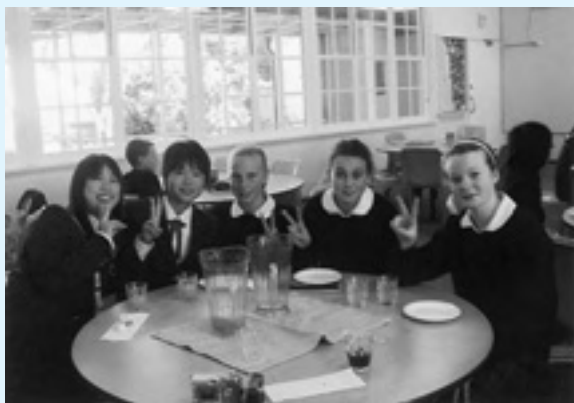
▲学校訪問での楽しいひととき。

本当にたくさんのおすてきな思い出が出来て、私の一生の宝物になりました。今回の事業に関わったすべての方々に感謝の気持ちでいっぱいです。