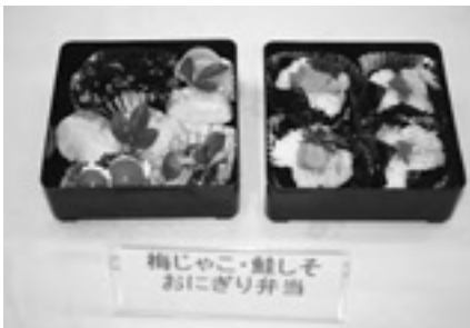
梅じゃこ・鮭しそおにぎり弁当