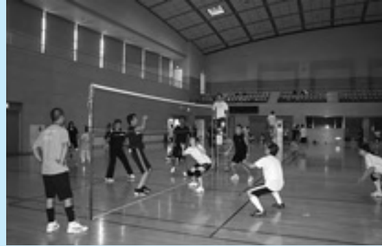
▶ 激しいラリーが続いた試合

その他町内の各施設においても、各団体や地域の方々に除草作業を実施していただいております。皆様のご協力に感謝いたします。