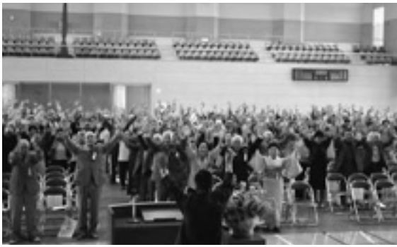
▲出席者全員で万歳三唱をして長寿を祝いました

なお、平成19年9月1日現在で作成した長寿番付に掲載された80歳以上の方は、男性が226名、女性が512名の計738名でした。