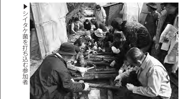
▶シイタケ菌を打ち込む参加者

町民総ぐるみによる「環境美化運動」が3月25日の早朝に行われ、子どもからお年寄りまで約2,300人の町民が参加しました。参加者は、町内に投げ捨てられたゴミを拾い集め、1時間後には空き缶約1トン、空きビン・埋立ゴミ約3.5トン、燃えるゴミ約3トン、その他の粗大ゴミ等約1トンを回収しました。ご協力ありがとうございました。