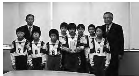
▲尚英ガッツJVCのみなさん