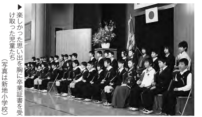
▶楽しかった思い出を胸に卒業証書を受け取った児童たち (写真は新地小学校)