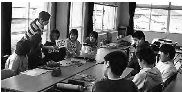
▲小学6年生を対象に行われる「ハローイングリッシュ教室」

学校教育では「健やかで心豊かな児童生徒の育成」と「開かれた学校づくり」と基礎学力の向上」を重点事項に掲げ、効果的な教育振興施策に積極的に取り組んでいきます。 このため、環境教育とボランティアや職場実習活動などの体験教育、総合学習での国際理解教育などの特色ある学校運営、教育奨学資金貸付事業や基礎学力向上推進事業を継続します。