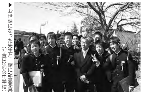
▶お世話になった先生と一緒に記念写真 (写真は尚英中学校)

尚英中学校、町内の各小学校及び各保育所で卒業式と満了式が、それぞれ行われました。尚英中学校では109人が、町内の三小学校では合計86人が卒業し、それぞれ楽しかった思い出を胸に、新しい生活に向けて旅立ちました。また、三保育所では合計77人が満了となりました。