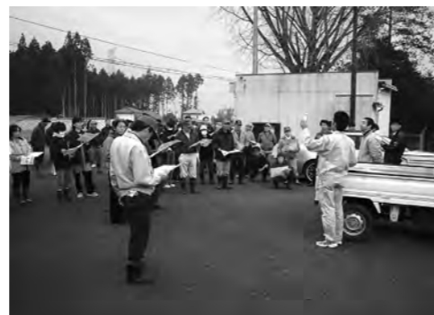
▲3月25日に高田公会堂前で行われた「家庭ゴミの出し方について」の出前講座

町内に限ります。 申込方法 原則として講座開催希望日の20日前までに、町生涯学習課へ申し込んでください。なお、担当課の業務や日程などの都合で、開催日時など希望に添えない場合もありますのでご了承ください。 ●申し込み・問い合わせ 生涯学習課 (新地公民館) (☎20085)