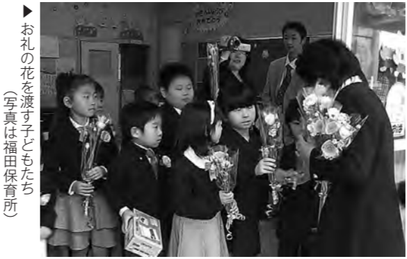
▶お礼の花を渡す子どもたち (写真は福田保育所)