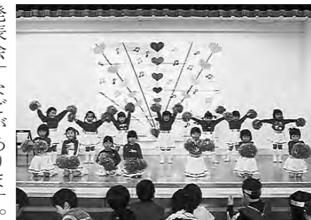
▲昨年度に行われた「保育発表会」の様子