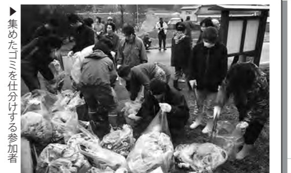
▶集めたゴミを仕分けする参加者