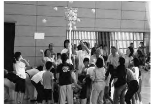
▲昨年度に行われた第7行政区の「ニミススポーツ大会」の様子