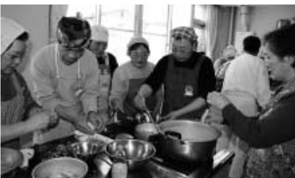
▲食事で健康「薬膳料理教室」