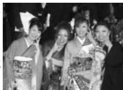
▲年金を支えるのは若い世代の力です。(写真：今年1月の成人式)

対象者は「平成3年3月以前の国民年金任意加入対象であった学生」並びに「昭和61年3月以前の国民年金任意加