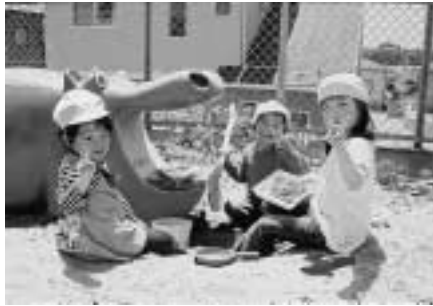
▲ やっぱり、子どもの笑顔はかわいいですね。

小さいお子さんをお持ちの方で、「楽しく子育てしてしまいか?」「どう聞いても」「はい」と答えられる方は、どのくらいいるでしょうか。1~3歳くらいの子どもの場合は片時もじっとしていません。言う事は聞かないし、部屋の中も散らかし放題です。ね親もイライラがつつのり、「かわいさ」より「大変」を実感されているのではないでしょうか。