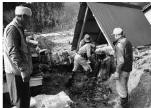
▲できあがった炭を取り出すクラブのみなさん

できあがった炭を手に、「上々の出来で満足。暖かい季節は、農作業などで忙しいため、主な活動は冬場に限定してしまいが、健康づくりにちよつといい。今後もあるなことに取り組んでいきたい」と、クラブの皆さんが笑顔で話してくれました。炭づくりは4月下旬まで行う予定で、できあがった炭と木酢は希望者に時価でお分けするそうです。