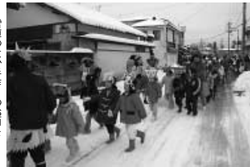
▶雪道のなか手作りのお面をかぶって行進する子どもたち