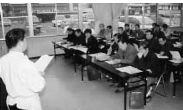
▲料理の説明を真剣に聞く参加者