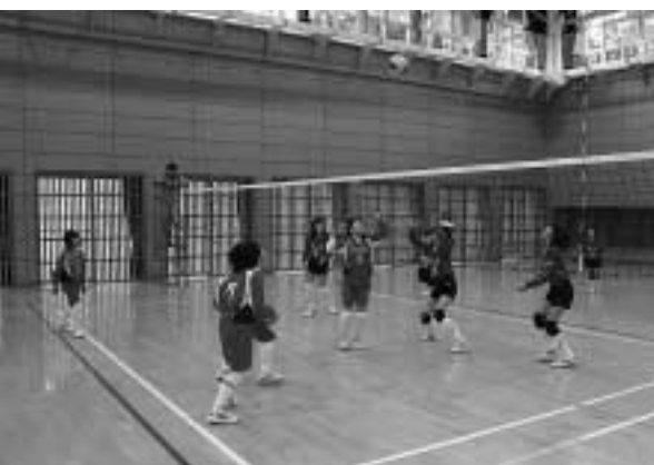
▲プレーを通して交流を深めた選手たち