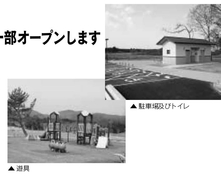
▲ 駐車場及びトイレ