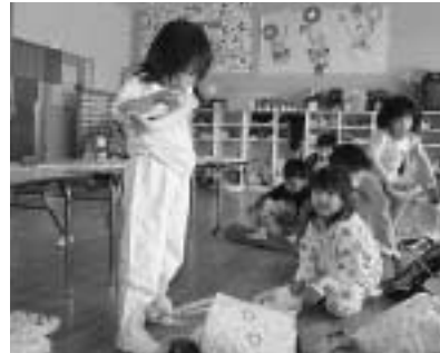
▲もうひとりで着替えられるよね。