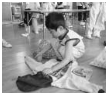
▲上手にたためるよ。

春風の強さ(ロ)の歳児(クちゃん)風を、おひまわりのなかへ「フリン」ひまわり「あつたのな」