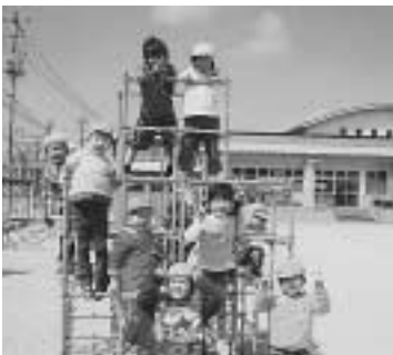
▲いっしょに遊ぶぞ〜。

そこで、欠かせないのが汚れを気にせずに遊べる、動きやすい衣服であることです。汚れた衣服は、自分で着替えてお家にもちかえります。