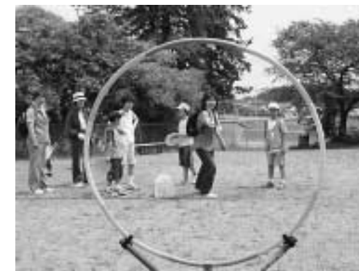
▲ 昨年のウォークラリー大会のようす