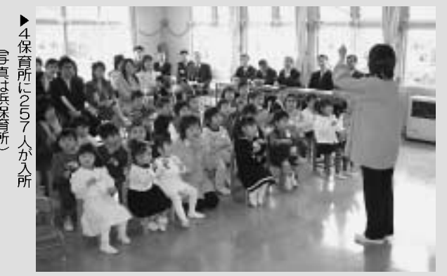
▶4保育所に257人が入所(写真は浜保育所)