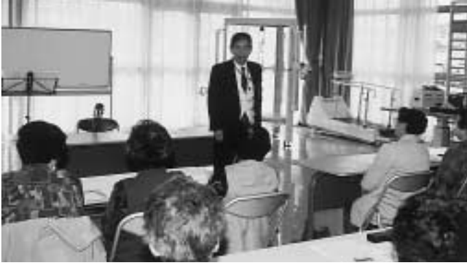
▲昨年の出前講座の様子（しんちの学校教育）