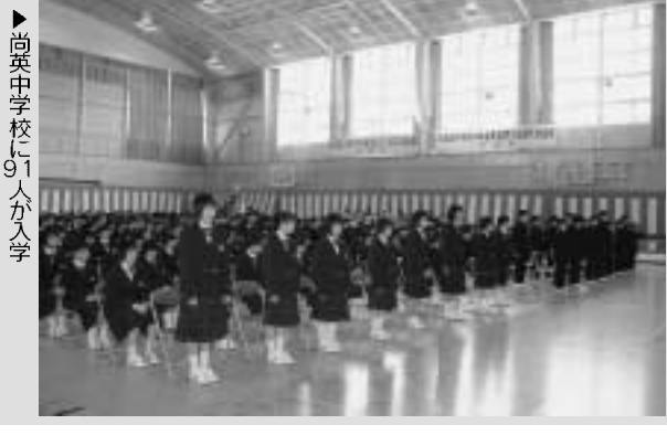
▶尚英中学校に91人が入学

町内4保育所の入所式が4月4日に、3小学校と尚英中学校の入学式が4月6日にそれぞれ各保育所、小・中学校で行われました。 保育所への入所者数は275人、入学者数は小学校が80人、尚英中学校が91人でした。 子供たちは、緊張の中にもこれからの保育所や学校での生活に胸をふくらませていました。