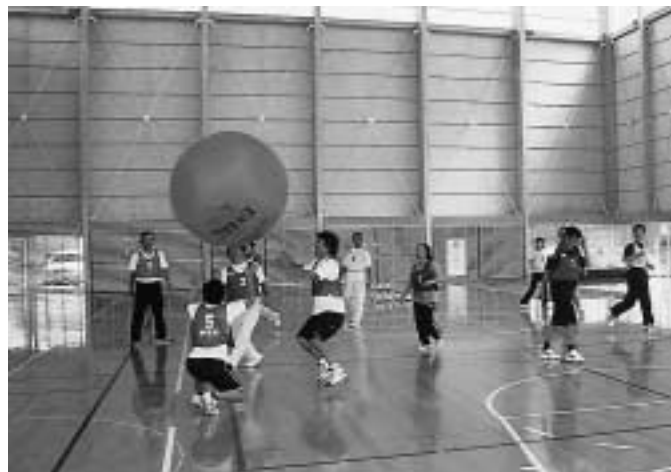
▲ニュースポーツ教室（キンパレー）