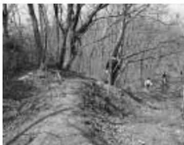
▲山頂から鈴宇峠までのコース。途中、分岐点が3カ所あります。

鹿狼山の新しいコースは、山頂から北へ、鈴宇峠に抜けるコースと、途中、パンピリンゴ園へ出るコースの2つです。3月末に下刈りなどを行いました。分かれ道や急な坂などがあるので歩くときは、十分注意してください。案内板や休憩所はこれから設置する予定です。詳しくコースを知りたい方は、町企画振興課(☎2112)へご連絡ください。