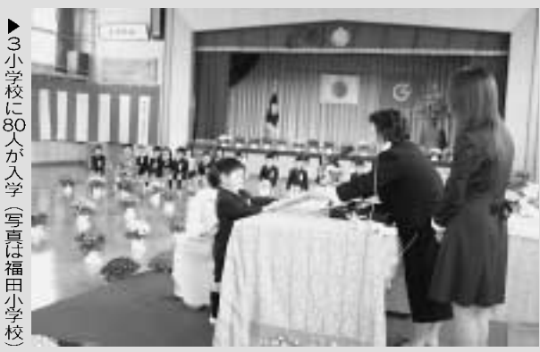
▶3小学校に80人が入学(写真は福田小学校)