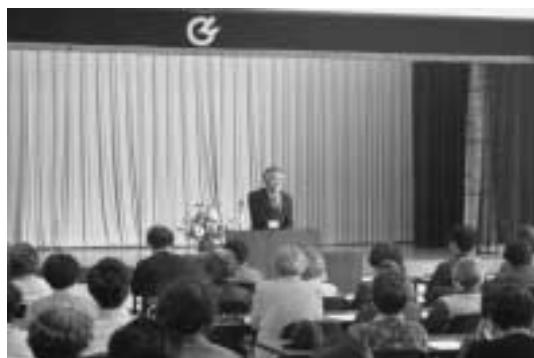
▶ 講話に聞き入る参加者