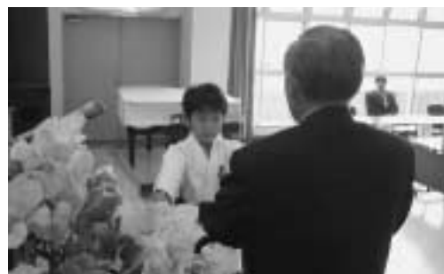
平成14年度の受賞者