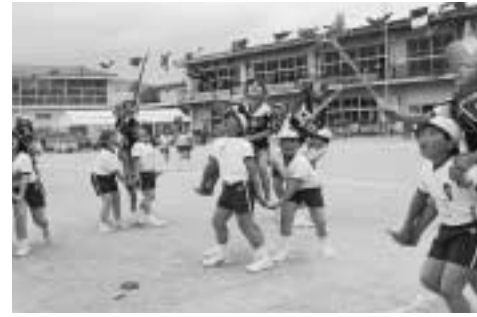
福田小学校「福田野馬追い」