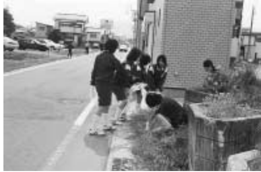
▶ 丁寧にごみを拾い集める生徒たち

尚英中学校では社会性や思いやりの心などの豊かな人間性を育むことを目的に5月21日、尚英中学校・新地駅・役場周辺などでクリーン作戦を行いました。1年生から3年生がそれぞれ担当の場所へ移動し、ごみの分別をしながら投げ捨てられたごみを拾い集めました。