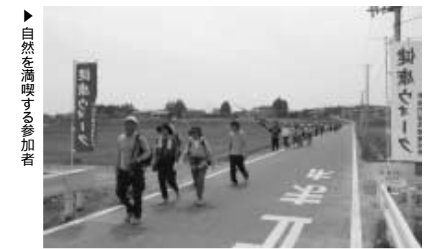
▶自然を満喫する参加者

「健康ウォーク」自然の中を歩こう会 みどりの日恒例の、自然の中を歩こう会が4月29日、約80人が参加して行われました。改善センター前をスタートし総合公園や新地城址で行われていたチューリップ祭りの会場など、約8キロのコースを自然を満喫しながらゆっくり歩きました。 ゴールした後は、各地区婦人会の皆さんが用意した豚汁がふるまわれました。