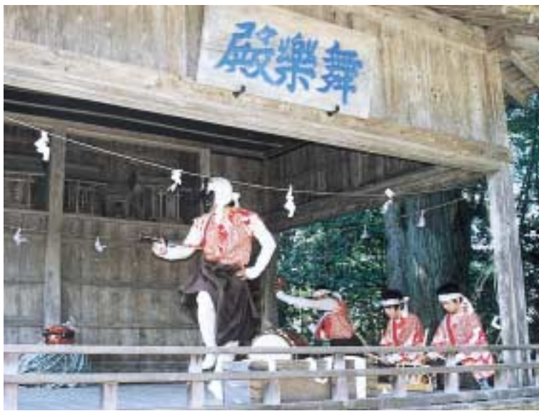
◀県重要無形文化財「福田十二神楽」の奉納