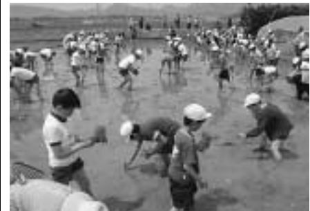
駒ヶ嶺小学校の児童