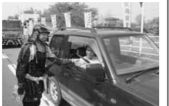
▶ 交通安全を呼びかける関係者

今回で16回目となる「伊達と相馬の関」が5月14日、国道6号線の新地町と山元町の県境に、交通事故防止のため開設され、新地、相馬、山元、巨理の関係者が通行するドライバーに安全運転を呼びかけました。参加者たちは伊達藩と相馬藩にちなみ、鎧甲に陣羽織姿などで交通安全の絵馬や眠気覚ましのカムなどをドライバーに手渡ししました。