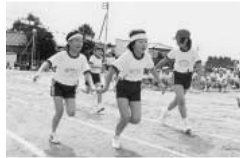
新地小学校学年リレー

町内の各小学校で、それぞれ運動会が行われました。各小学校とも工夫を凝らした競技からお馴染みの競技など20種目以上行われ、子供たちや保護者らが青空のもとで元気いっぱい運動会を楽しみました。