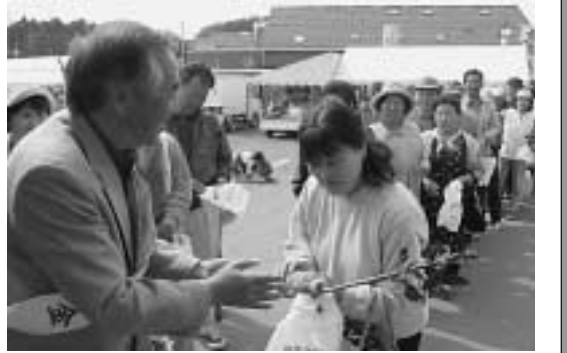
▶ 苗木を求める来場者

今年で17回目となる「新地種苗市」が5月10～11日の2日間、農村環境改善センター前駐車場で行われ、約1000人の来場者がありました。10日には、町緑化推進委員会より、ゆず、カマズミ、エゴノキ、ヒメクチナシ、ローズマリー、ヤマザクラなど6種類の苗木300本を無料配布し来場者を喜ばせていました。