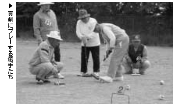
▶真剣にプレーする選手たち

「健康ウォーク」自然の中を歩こう会 みどりの日恒例の、自然の中を歩こう会が4月29日、約80人が参加して行われました。改善センター前をスタートし総合公園や新地城址で行われていたチューリップ祭りの会場など、約8キロのコースを自然を満喫しながらゆっくり歩きました。 ゴールした後は、各地区婦人会の皆さんが用意した豚汁がふるまわれました。