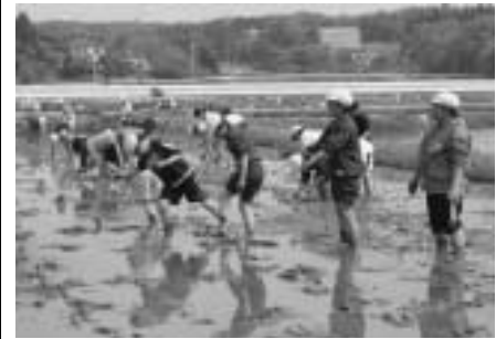
福田小学校の児童