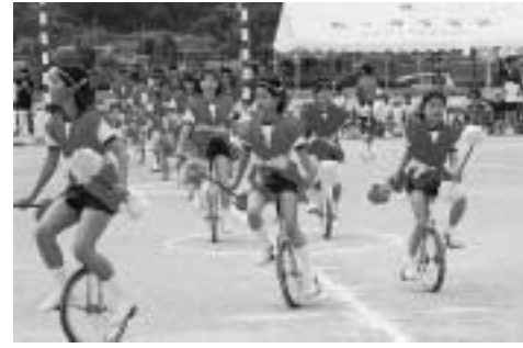
駒ヶ嶺小学校一輪車クラブ