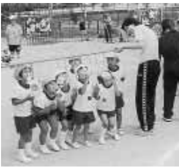
▲9月8日の運動会 (左上:福田保育所、右上:駒ヶ嶺保育所、下:濱保育所)