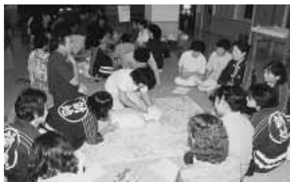
▶人形を使った実技に真剣な表情の受講者たち

講習会では、受講した隊員 約90人が、分署職員から応急 手当の目的や必要性の説明を 受けたあと、人形を使った実 技に入り、人工呼吸の要領や 心臓マッサージなどの心肺蘇 生法、2人1組になっての止 血法などを学びました。