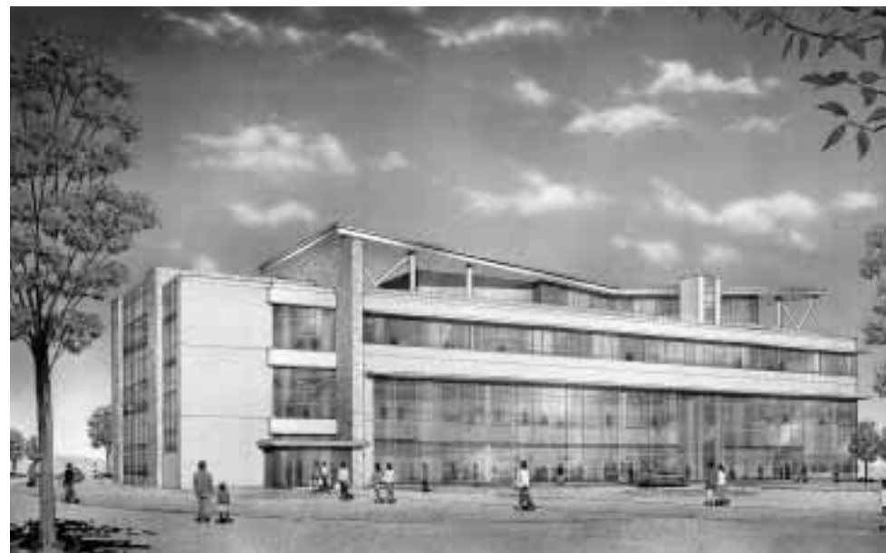
▲イメージパース（南西の方向から見て）