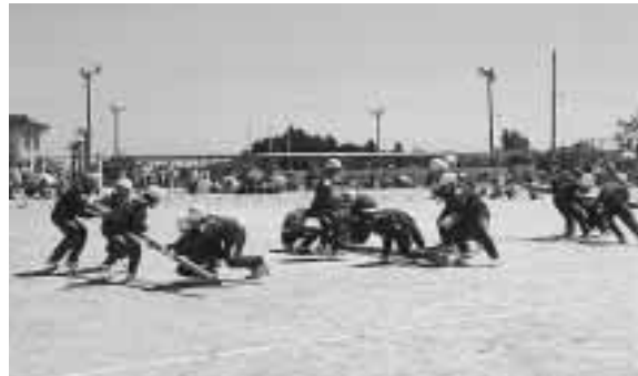
▶熱戦を演じた「棒引き」