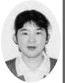
こんにちはは保健婦です