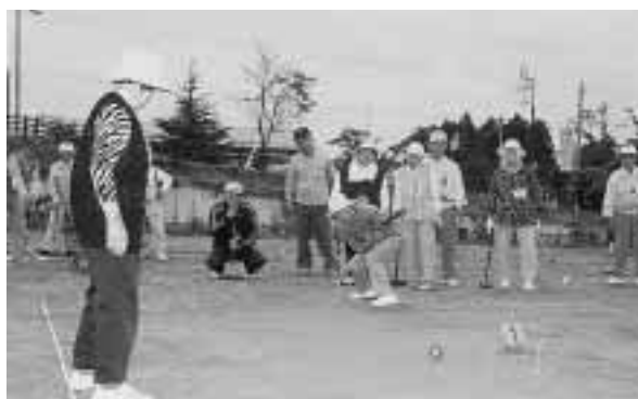
▶交通安全ゲートボール大会