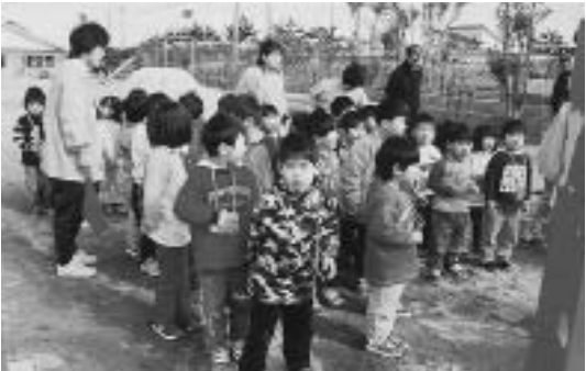
▶地震、津波はとっても怖いので訓 練も真剣です

「浜通り地方に激しい地震 が発生・震源地は福島県沖、 震度 7で、津波注意報が出 ました」。火災の時と同様、