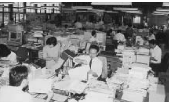
▶ 役場の事務風景。組織の再編が必要になってきています。

地方分権に対応した簡素で効率的な組織・機構の構築 省庁再編及び県の機構改革の動向等にも留意した総合的な見直し 原則として既存の組織を再