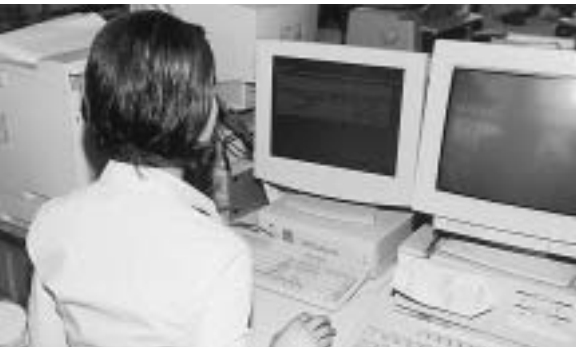
▶ ITの進展に伴い一人1台のパソコン整備をめざします

行政の効率化 行政の情報化等 行政サービスの向上 IT革命に伴う地方公共団体の電子化（電子自治体）及び地域社会の情報化に対応した行政システムの構築を図るものとします。 住民基本台帳ネットワークシステムの整備 庁内LAN及び一人1台パソコンの整備 総合行政ネットワークとの接続 窓口等における対応の改善と行政サービスの総合化