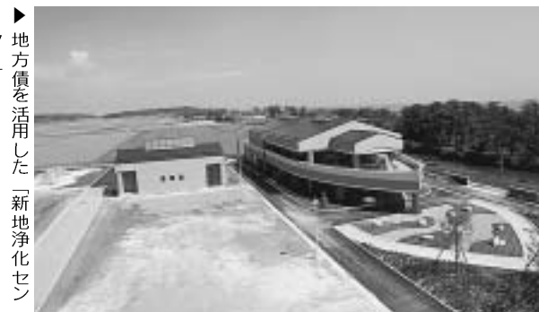
▶ 地方債を活用した「新地浄化センター」

今後、この計画を基本として行政改革の推進に努め、地方分権など新しい時代に対応した行政システムの整備を推進して行くことにしています。