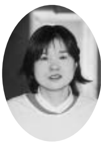
こんにちはは保健婦です