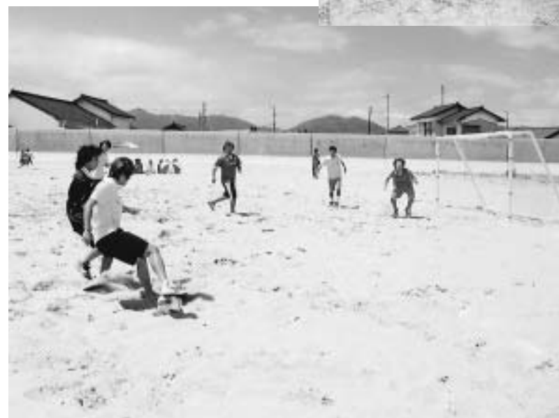
▲▼ 熱戦をくりひろげたビーチサッカー(上)とビーチバレーボール(下)