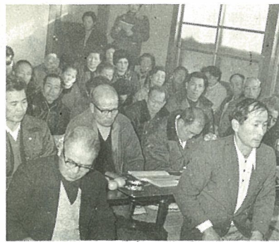
質問も道路・老人福祉対策...

町政懇談会が、一月二十日上真弓公会堂、二十三日新地町公会堂で開かれました。この懇談会は、町民の声を直接町政に反映させようとするもので、町長をはじめ町関係者、町民多数が出席、町政全般にわたり意見をまじえての話し合いが行われました。