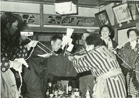
その家の繁栄がゆるがないように、地がためがはまる

今月の「カメラでこんにちは」は、「かせどり」 かせどりは、一月十四日の夜、七福神や花嫁などの仮装した人達が、四十二歳、六十二歳などのやく年にあたる人がいる家をやく流しにあるく行事で、最近では、あまりみられなくなっています。