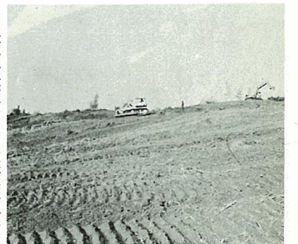
造成工事が始まった東洋護膜化学(新地北工業団地)

大きく前進 町の農業就業人口は、年々減少の傾向にあり、兼業農家が増加し 造成工事が始まった東洋護膜化学(新地北工業団地) 農業経済の農外依存度が、高まってきた。こうした現状をふまえて、今後の農業振興計画は、農業振興法に基づく農用地利用計画、農業生産整備計画、農地等の権利取得の円滑化計画、農業近代化施設整備計画等を総合化したものとし、昭和五十二年において「農村総合整備事業」の指定をうけ、総合的な整備を進めることにしています。