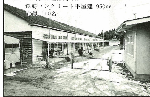
鉄筋コンクリート平屋建 950㎡ 定員 150名