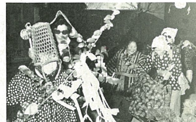
「まいこんだ、まいこんだ福の神がまいこんだ」のかけ声で訪問