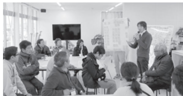
▲UDC しんちでのワークショップ

Q 選挙管理委員会費が、前年度比2776千円増えているが、何が要因か。 A 選挙人名簿、システム改修費用のため。 Q 防災無線の文言がわかりづらい。改善できないか。 A 広報時には、わかりやすい言葉にしていく。 Q 昨年11月にオープンしたUDCしんちの活動について伺いたい。 A 地区情報の発信や町民参加型のイベントを行っている。具体的には、町づくりニュースの発行、駅周辺町あるきツアー及びワークショップ、観海堂公園イルミネーション等