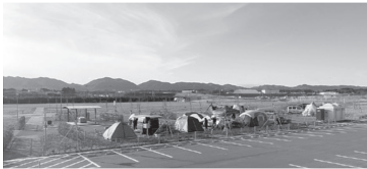
▲釣師防災緑地公園内オートキャンプ場

原子力災害対策措置法による避難等をした世帯に係る国民健康保険税及び介護保険料の減免期間を、令和2年度分まで延長するなどの改正を行うもの (全員賛成で可決)