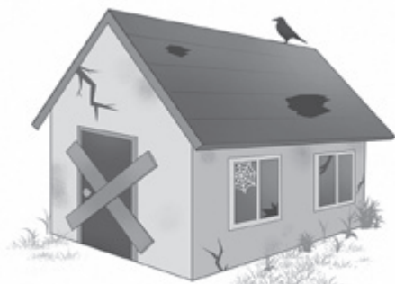
▲増え続ける空き家

議員 再利用不可能な「不良空き家」は、周辺住民に悪影響を与える。そう言った空き家は、空き家対策特別措置法に基づき、特定空き家に指定し、対策を取って行くべきである。 現在町では特定空き家指定している空き家はあるのか。また特定空き家と思われる空き家を現状どのくらい把握しているのか。 町長 現在、特定空き家に認定した空き家は無い。また特定空き家と思われる空