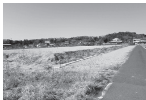
▲公民館・体育館建設予定地

議員 建設が予定されている駒ヶ嶺公民館は、災害時避難場所指定される。昨年の台風19号及びその後大雨の影響により2度続けて避難勧告が発令された地区にある。 災害弱者などを考慮し、空調設備を導入すべきでないか伺う。 町長 建設予定の駒ヶ嶺公民館は、完成後に災害時避難場所に指定する。災害時避難した場合、空調が必要とされる方については、体育館ではなく、会議室を開放する。 議員 災害時には、停電も