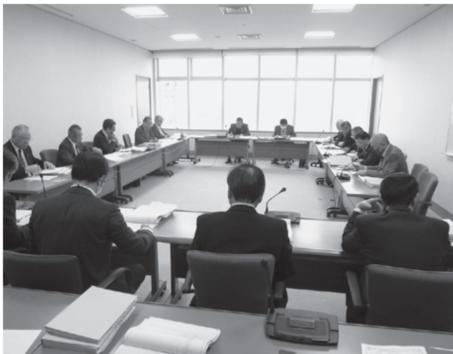
▲予算審査特別委員会

71億4000万円対前年度比1億4000万円の増となつてゐる。更に、17件で7億4411万円の事業が繰り越され、執行すべき予算総額は78億8411万円となつてゐる。これまで復旧・復興を最