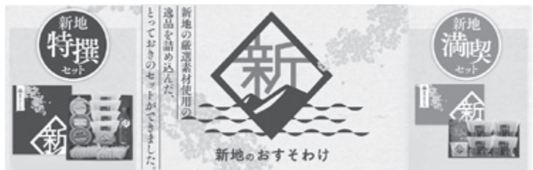
▲現行の返礼品：新地町特産品セット

議員 返礼品に宿泊施設の宿泊券や、今年度完成予定のパンプトラックの利用券を設定すれば、直接足を運んでくれる方が増える。地域一丸して、更なるPR活動に励みましよう。