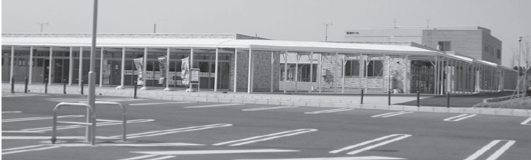
▲誘客を図る観海プラザ

議員 コロナウイルス感染問題で学校が休みになったり、イベントやスポーツ大会などが中止になって宿泊所・飲食店や関係する商店では大きな痛手を被っており、このような状況の中で、町として何らかの手を差し伸べる必要があるのではないか。 町長 新型コロナウイルス感染症の影響で、宿泊施設や