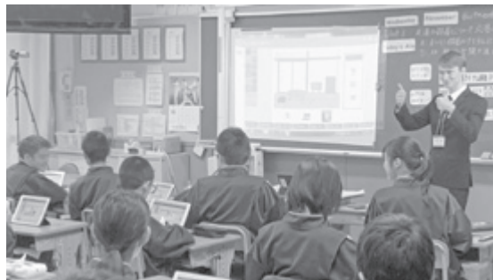
▲ゆとりある教育環境を

いるが4月から現場は新学習指導要領実施で業務量が増える。(道徳の所見、小学校英語、プログラミング教育等)ゆとりある環境を作るためには教職員の定数増、不要不急の業務、報告書等の精選、削減が重要だ。各学校に「変形労働時間制」を押し付けるべきでない。 国では「GIGAスクール構想」で23年度までにすべての国公私立の小中学校、特別支援学校に校内LANの整備と児童生徒一人一台のPC端末(4.5万)の整備を図るため4123億を投入し学校のICT化を図るとしている。新地町は2011年からICTの取り組みをしているが、維持管理等に年間6333万かかっている。計画的な維持管理、更新を行い教育は人づくりの観点から子供たちが知性や感性をはぐくみ社会を力強く生きるための人間性あふれる人格の形成を目指すべきだ。 町長 現在、県では「アク