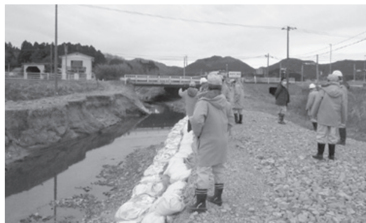
▲台風被害の状況を調査