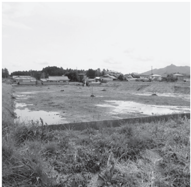
▲福田住宅造成予定地

会社猪狩組が9130万円で落札したため、請負契約を締結するもの (全員賛成で可決)