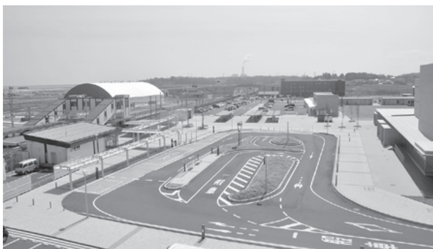
▲整備が進んだ新地駅周辺

議員 平成16年に開始したのりあいタクシー「しんちゃんGO」は、平成18年の乗客数29465名をピークに平成30年には19689名まで減少している。 低料金で自宅から目的地まで行くデマンド方式は好評である一方で、土日祝日は運行しない、相馬方面の利用者が少ない、夕方の営業時間が短いなど、町民ニーズに対応しきれない様々な課題が出てきている。 また、新地駅前にはタクシーが停まっていけないため、「来町者の交通手段はどうするのか」といった声が多く聞かれる。 震災後9年が過ぎ、町の環境も大きく変わってきた。交通弱者対策として、しんちゃんGOとタクシー等の新たな公共交通システムの見直しが必要でないか。 町長 しんちゃんGOは、平成16年の運行以来、見直しを行わず運行してきたが、震災後、防災集団移転