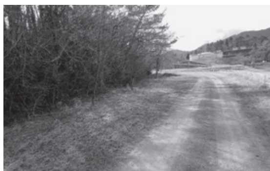
▲環境整備が必要なダム周辺

予想される。公民館全体をカバーする自家発電を設置するのかが伺う。 町長 自家発電については、常設は考えていない。外部取り付けを考えている。 災害時協定を結んでいる業者があり、全体をカバー出来る電源をレンタルする様に努力するが、緊急事態でもあり、そうでない場合は、少々我慢していただくことになる。 議員 豪雨災害やダム決壊を想定した盛り土工事が必要ではないか伺う。 町長 高さは取付け道より80センチ、県道394号線より約2メートル高い。更に周囲をL型擁壁にするので、浸水被害は想定していない。 鴻ノ巣ダム周辺の環境整備を 町長 土地改良区と連携し支援していく 議員 鴻ノ巣ダム周辺の環境整備については、町管理地であり、行政主導で行う