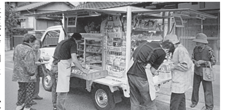
▲他地区移動販売車での買い物

議員 現在の高齢化率は32割に及んでいる。今後、毎年1割程度の増加が予想されており、当然一人暮らし世帯や高齢者世帯がさらに多くなると思われる。これらのことから、高齢者たちの買い物にますます支障を来すことが容易に想像される。 町長 買物弱者の支援対策として移動販売車の導入を図るべきと思うが、見解は。 議員 買物弱者が問題となってきた。この問題は、町外への消費購買の流出ばかりでなく、高齢者の見守りや生活支援など福祉的側面を持っている。移動販売車のニーズは不透明ですが、見守りや、外出のきっかけになることから、今後の高齢化社会に向け必要なサービスの一つと考えている。 議員 ニーズが不透明との