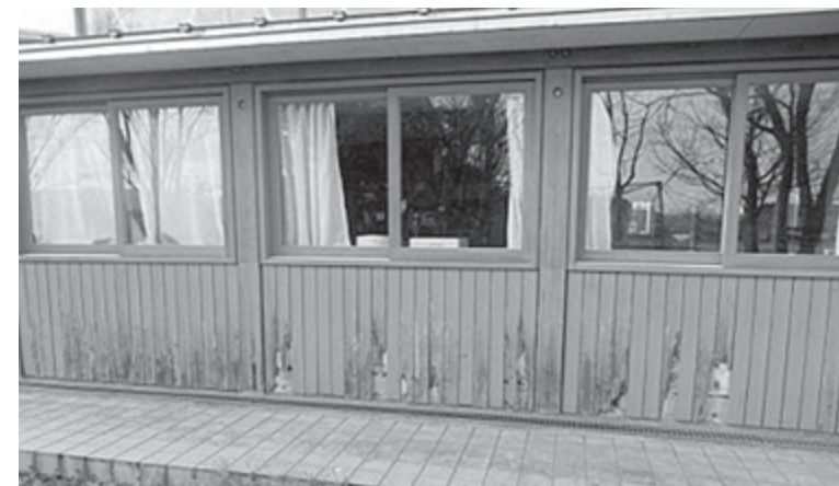
▲外壁が腐食している駒ヶ嶺小学校

の拠点施設やライフラインの機能確保が必要となる。 時代の要請や町民のニーズに対応するためにも、その重要性を勘案し関係部署との連携を図り、計画的な維持管理に努められたい。