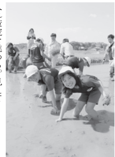
▲安心して暮らせる町を

議員 第5次総合計画は、平成23年度を初年度として令和2年度を目標に「人と自然が共に輝き笑顔あふれる町づくりを」基本理念に取り組んできた。東日本大震災の復旧復興に2次にわたる復興計画策定や「国土利用計画」、「まち・ひと・しごと創生総合戦略」、平成28年度には後期計画の見直しをかけているが、人口フレームは、現状と大きな開きがあり、達成度はどの位にあるのか。評価については、シートにより300項目を超える検証を行っているが、外部評価の必要性を含め、どの様に総括し、課題をどの様に考えているか伺う。 町長 第5次総合計画期間中に実施した各事業の進捗、成果、課題を精査中であり、全体を総括整理しながら次期計画策定を進める。行動計画の約300事業について担当課に於いて成果の検証と併せて住民参画から得られる意見を取り