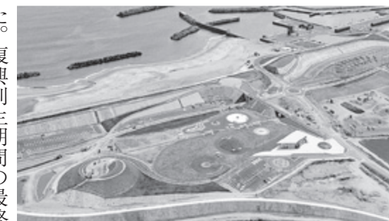
▲釣師防災緑地公園

町長の施政方針で、復興・復興事業の最優先課題であった防災集団移転や災害公営住宅などの住まい再建が完了し、新地駅前周辺整備事業や防災緑地公園など、新たなまちづくりの中心となる施設もオープンし