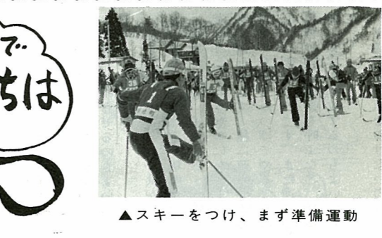
▲スキーをつけ、まず準備運動

末まで延納することができません。なお、便利な納税の方法として、振替納税の制度もありますので、利用されるようお勧めします。 税に不服のあるときは 税務署からの更正、決定の通知や、差押えなど税務署の処分について不服があるときは、税務署長に対して「異議申立て」をすることができます。異議申立てが出されれば、税務署ではその内容を調査、審査して「決定」します。その決定に不服があるときはさらに、国税不服審判所長に対して「審査請求」をして救済を求めることができます。 「異議申立て」や「審査請求」は、必ず書面で行うことになっていますが、手続きなどで分からないことは、相馬税務署や国税不服審判所へお尋ねください。 国税不服審判所は、国税について納税者の権利救済のために設けられた機関です。課税や徴収に当たって税務署から独立した公平な立場で、審理、裁決を行っております。 △仙台国税不服審判所 仙台市本町三丁目二二三 ☎〇二二二二二二一七五六一