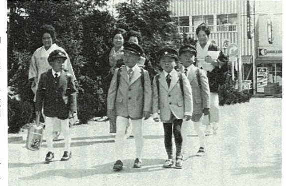
胸をはずませ校門をくぐる新入 児童(昨年の入学式・新地小)

勝気な子供が保育所や学校に 行きたくないときは「イヤ」 と口を出してゴネますが、内気 な子供は腹が痛いか頭痛が痛い といった、間接的に表現します。 イヤになった理由はと聞くと、 ランドセルが友だちのよりよく ないとか、ちよつとしたことが 原因になっています。 また、幼い的な感覚から、背 の高い先生とか声の大きな先生 を怖がりたり、授業中トントン カンな答えをしたために笑われ そのショックで登校拒否を起 すのもよくあるケースです。 子供は、いままでの遊び中心の 生活とは全くちがった環境に身を おくのですから、集団生活に一日 でも早くなじめるように指導し、 励ましてやってください。 では、どうすれば学校がらいに なるのを防げるかという、お母 さんとしては、まず子供が心理的 に疲れていないかどうかを見分け ることが先決です。学校に行くの をいやがっても「小学生になった のだから……」などと一方的に叱