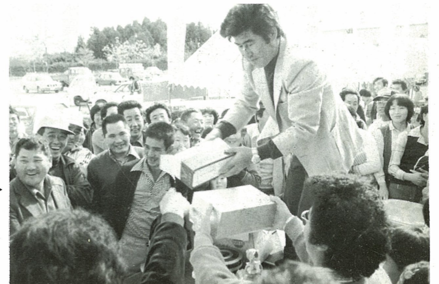
商工会青年部によるチャリティオークション なお、売上金45,730円は、町社会福祉協議会にご寄付がありました。

産業文化祭が十一月二、三日、公民館屋体、新地小、尚英中を会場に開かれました。 これは、町・農協・漁協・商工会が中心となって各種団体の協力を得て農民祭開催以来十数年ぶりに開いたもので、各団体の展示物や生徒達の作品展示、さらには芸能発表などが行われました。 町民総参加の文化祭だけに、両日どの会場も老若男女の町民でにぎわいをみせ、盛況のうちに幕を閉じました。