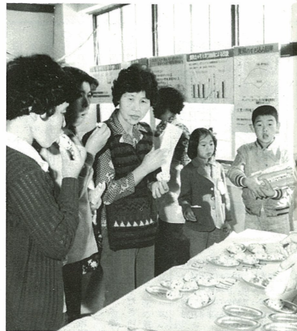
良質米生産と消費拡大に、生活改良推進員が催したコシヒカリの試食会