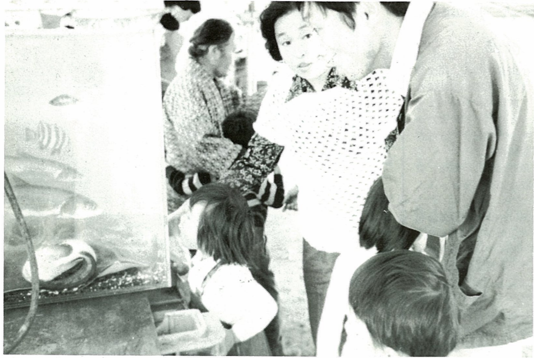
好評だった漁協による釣師浜沖捕獲活魚の展示