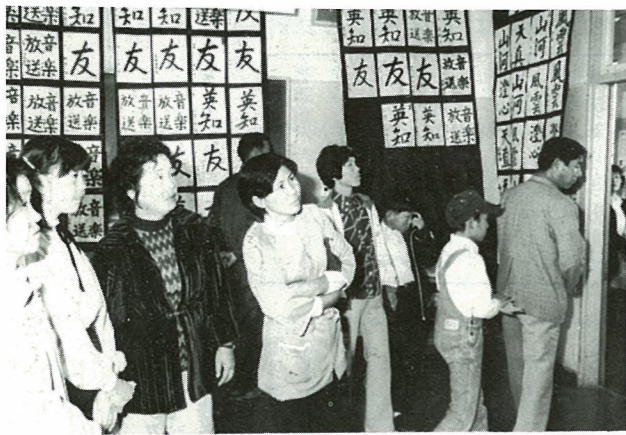
▲力作が並ぶ生徒達の作品展