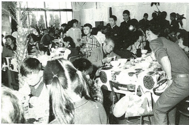
▲連日、満員御礼の尚英中模擬店“満腹食堂”