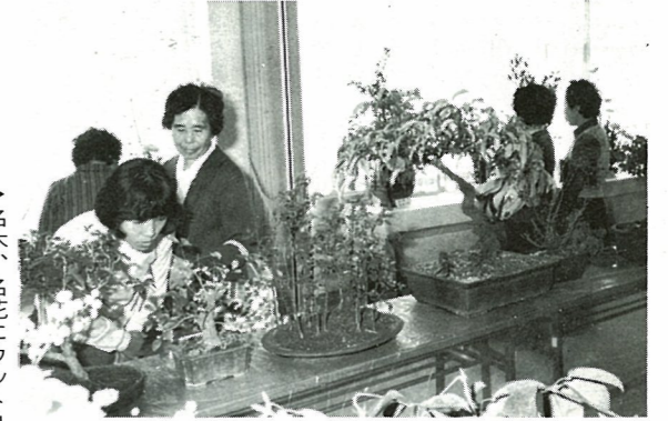
▶名木、名花にウットリの盆栽展、菊花展