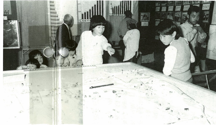
21世紀の夢をのせ、常磐新幹線、高速道が町をかける役場のパノラマ展示