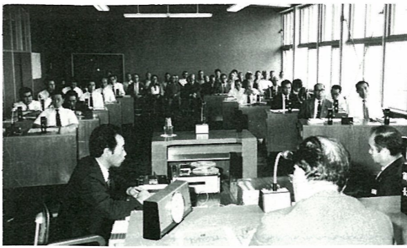
多くの傍聴者が見守る中で開かれた6月町議会

六月定例町議会が六月十三日から十七日までの五日、間の日程で開かれ、水道料金・国保税率の改定など九議案を審議し、原案通り可決されました。 議案の内容は次のとおりです。 ◆水道事業給水条例の一部改正 飲料水供給施設条例の一部改正 町の水道料金が、四年ぶりに改定されました。今回の引上げ率は平均五・八六割で、七月から実施されます。(四・五頁に関連記事) ◆国民健康保険条例の一部改正 今年度の国民健康保険の税率が表Iのように決定されました。また、課税限度額が二十二万円から二十四万円に引上げられ、減額対象世帯の範囲も拡大されました。今回の改定による一世帯あたりの平均課税額は、十万八千九百四十四円で、前年度比で七千九百三十二円の増、七・八五割の伸びとなっています。 ◆一般会計補正予算 今回の改正では二千五百三十九万五千円を追加し、歳入歳出をそれぞれ十五億九千九百九十九万五千円としたものです。追加した主なものは、