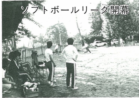
ソフトボールリーグ開幕

達勢の中に突進奮戦して討死した杉目参河と木崎右近は、相馬方の戦功者として長くたたえられた。また、参河の下女は、主人の子と自分の子を背に負い胸に抱えて逃げようとしてつかまり、自分の子を参河の子だと言って差しだし、主人の子を護った美談も長く語りつがれた。 降伏した泉田甲斐は、その後小高の同慶寺に身を寄せていたが、豊臣方の堀久太郎に認められて上方に行き修業し、清覚上人となって豊臣秀頼の枕博士になったといわれる。 新地での戦いの翌年五月、石上童生淵の戦いを最後に、伊達と相馬の長いどろ沼の争いに終止符がうたれた。五十一年の間に、合戦は約三十回に及んだ。世は豊臣の天下となり、秀吉の命で、諸國の私戦は厳禁となったのである。(目黒 美津英)