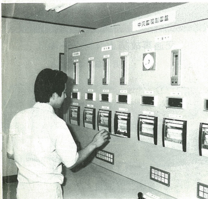
完成した浄水場内部