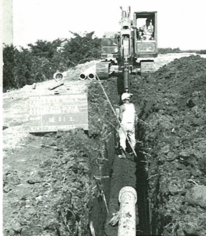
▲56年度の完成を目指して工事が進む広域簡易水道事業

料金改定の理由として、水不足解消のために昭和五十三年度から行われている広域簡易水道事業の事業費等の増加をあげることがで