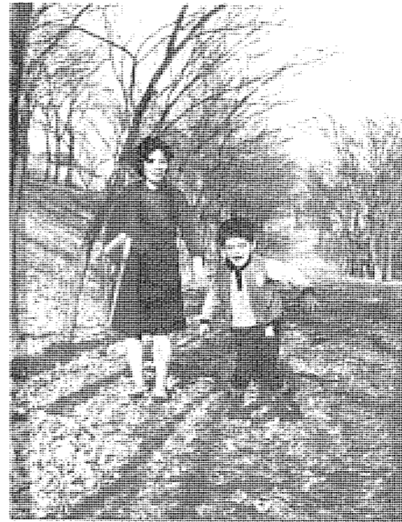
▲お母さんに見守られて歩行訓練

今年「国際障害者年」 いま、国内はもとより世界中で、障害を持つ人の社会への完全参加と平等の実現をめざして、いろいろな運動や催しが行われています。 障害をもつ人に対する理解と関心を深め、みんなが参加し、みんなが平等に暮らせる社会づくりをしようという年——「国際障害者年」に当たって、みんなが考えよう