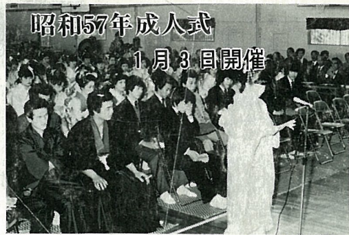
昭和57年成人式 1月3日開催