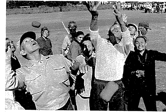
背中を伸ばしてヨイショ! (高齢者による玉入れ)