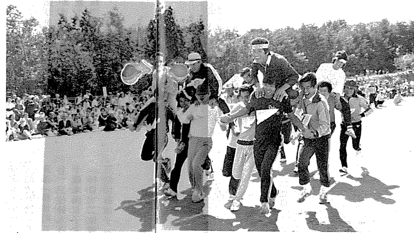
人馬一体 本日のメインレース、走れ走れコートを