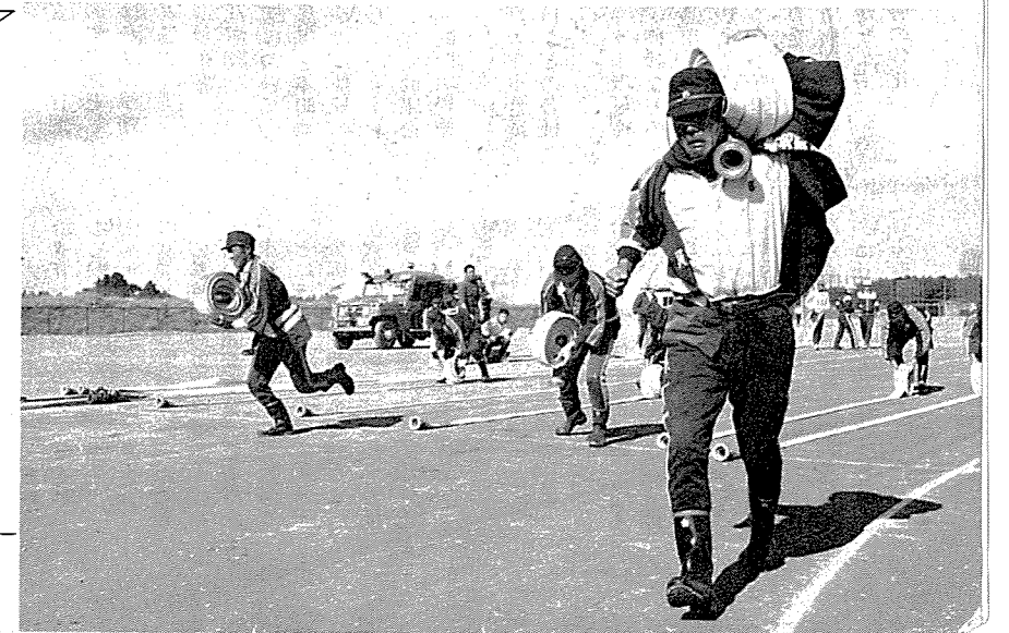
火災発生 消防団は緊急出動せよ