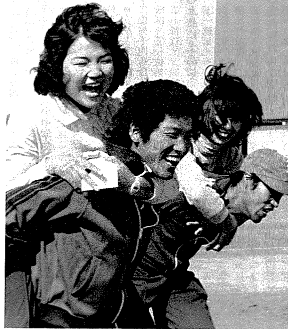
ボクと彼女の相性は? (相性テスト)