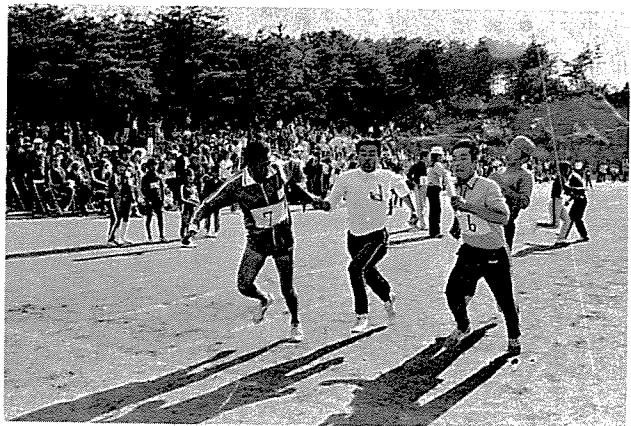
あとはたのんだぞ! (一般による行政区対抗リレー)