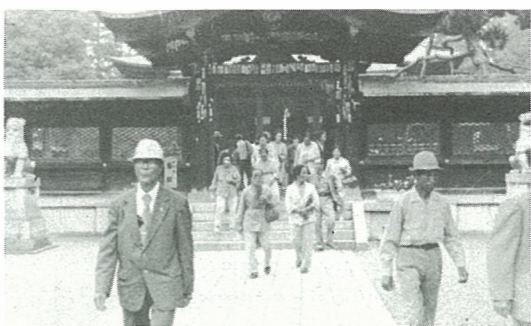
向学心旺盛な寿大学生 (山形方面への研修旅行)

折しも9月15日は「敬老の日」またこの日から一週間は「老人福祉週間」です。この機会に、すでに「老境にあるかた、これから迎えようとするかたはもとより、いずればおとしよりの仲間入りをする若い世代を含め、みんなが、自らの課題として、豊かな生きがいのある老後について考えていかなければならないと思います。