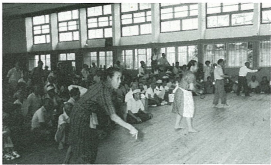
ゲートボールとともに大モテ (老人クラブ輪投げ大会)