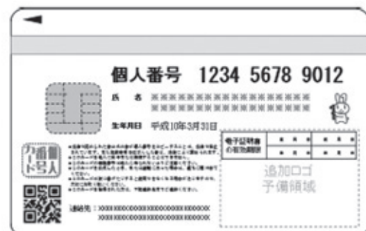
個人番号カード裏